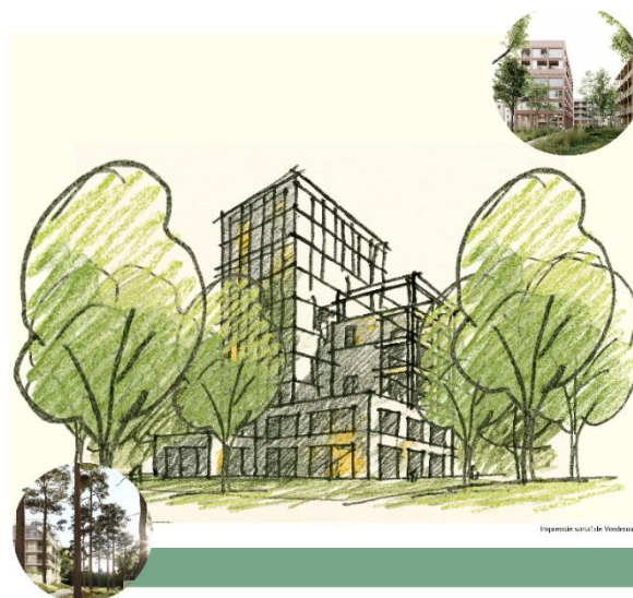
Beeld inloopavond april 2025.

Op de locatie waar nu de gekleurde Space Boxes staan, komt een nieuw houten gebouw met maximaal 84 sociale huurappartementen. De appartementen hebben één of twee slaapkamers. Het gebouw loopt in hoogte op tot 12 verdiepingen en wordt ongeveer 37 meter hoog. De omgeving wordt groen ingericht, als een park, en blijft toegankelijk voor iedereen. In het gebouw komt een fietsenstalling voor bewoners. Naast het gebouw komt een parkeerterrein voor de bewoners en bezoekers.