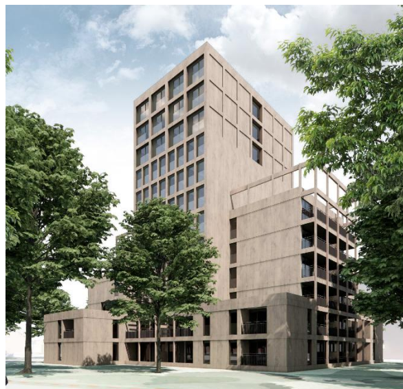
Visualisatie voorlopig ontwerp.

In het ontwerp zijn een paar dingen veranderd. Meerdere appartementen op de begane grond krijgen hun voordeur aan het park, in plaats van binnen in het gebouw. Hierdoor komt er meer leven rondom het gebouw en ontstaat er meer contact met het park. De gevel is nu verder ontworpen. De toren krijgt grote ramen, zodat het gebouw een open uitstraling heeft. Ook in de lagere delen van het gebouw komen grote ramen en balkons. De gevel wordt afgewerkt met een natuurlijk houtachtig materiaal.