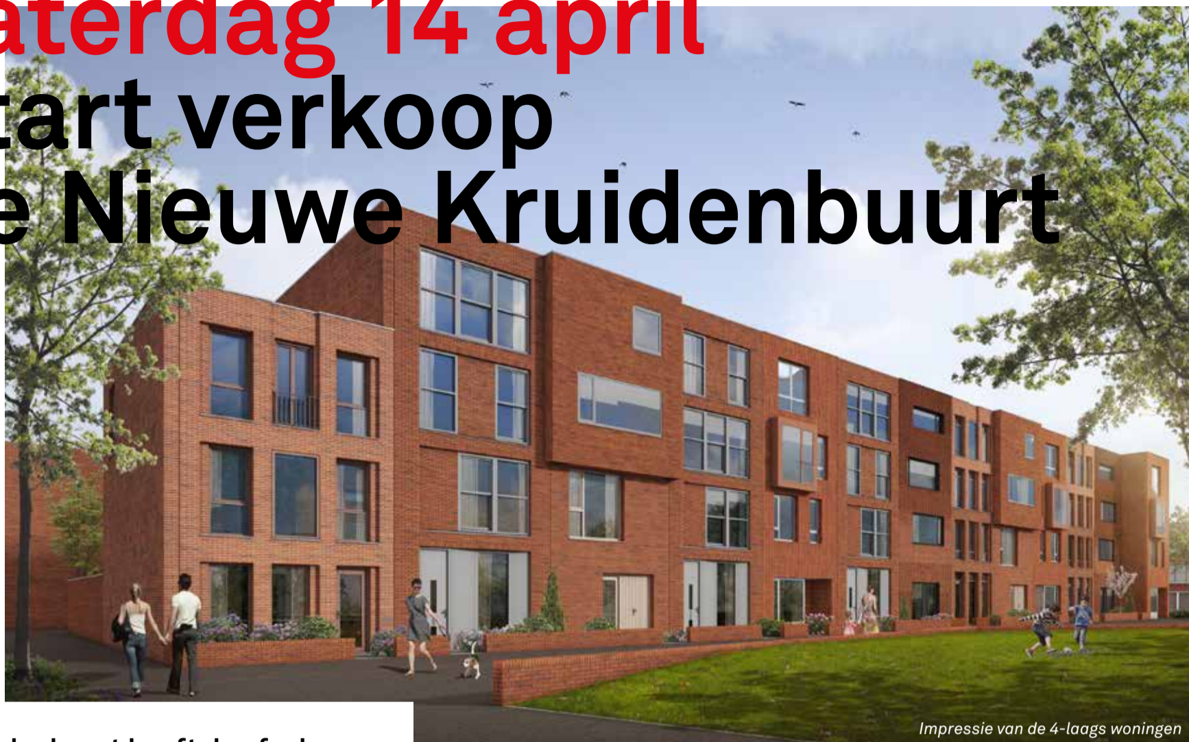
Impressie van de 4-laags woningen

De Kruidenbuurt heeft de afgelopen jaren een spectaculaire transformatie ondergaan. Een transformatie die in de laatste fase is aanbeld. De verkoop van 31 koopwoningen op de locatie waar de huizen straks staan. Deze laatste fase van de Kruidenbuurt is bijzonder omdat kopers nog heel veel zelf kunnen beslissen over het aanzicht en de indeling van hun huis.